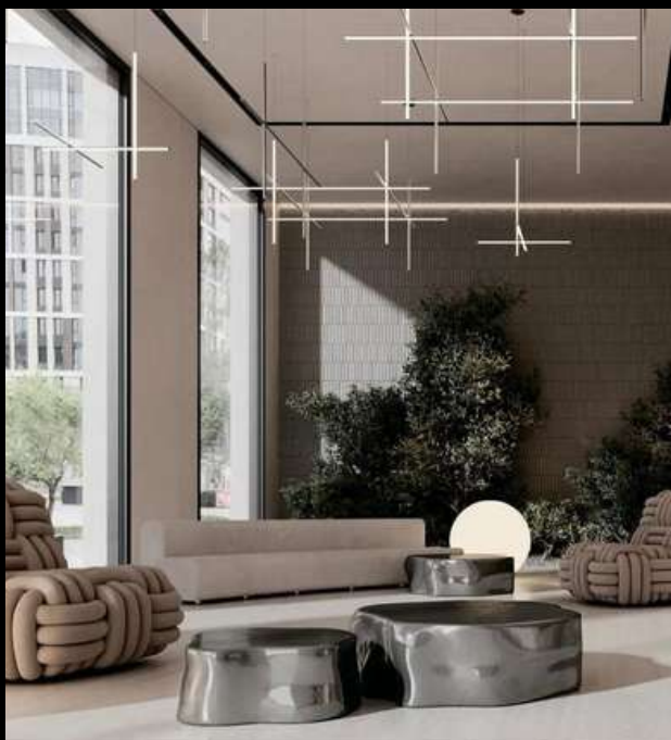
ЖК «ТАТАРСКАЯ, 35»